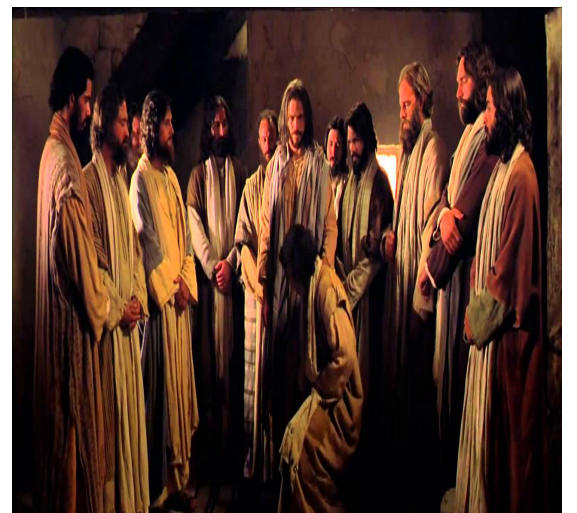
PEDRO, TIAGO, JOÃO... APÓSTOLOS PARA OS JUDEUS