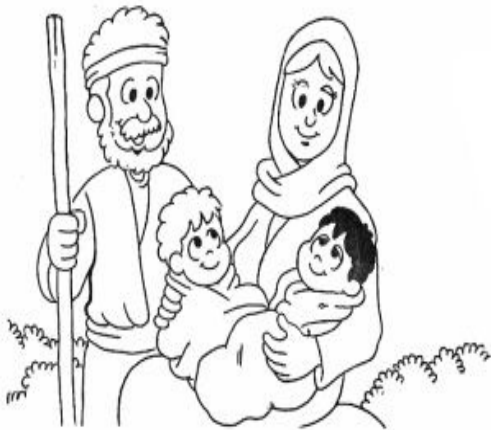
Isaque e Rebeca tiveram dois bebês gêmeos.

Segundo o propósito de Deus, ele escolheu a Jacó e aborreceu-se de Esaú. Recorde o texto, completando o verso abaixo, depois pinte as figuras.