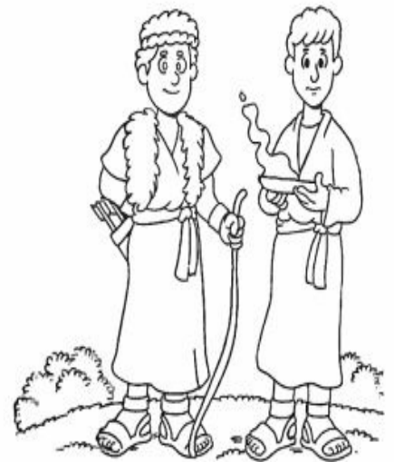
Esaú gostava de caçar e Jacó de cozinhar.

Pois não tendo os _____ ainda _____, nem tendo praticado _____ ou _____, para que o propósito de _____ segundo a eleição permanecesse _____, não por causa das _____, mas por aquele que _____), ROMANOS. 9: 11.